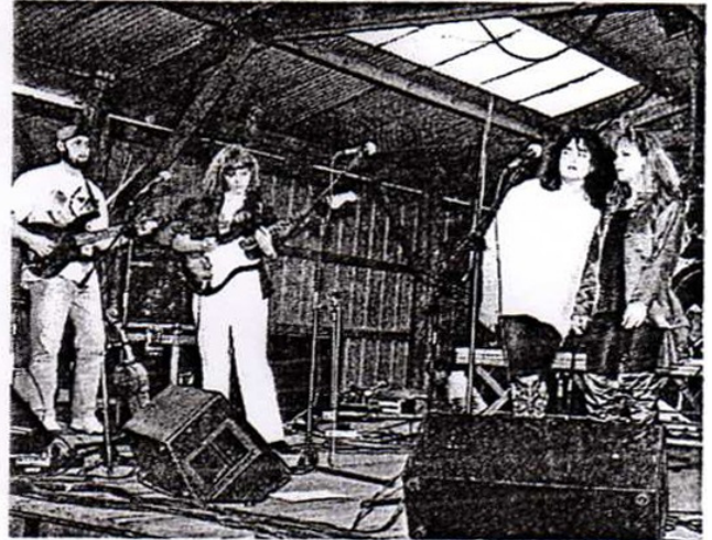
Le rock au féminin avec les Bloody Dolls

petit village de l'Hermitain, les échos des sons poussés à fond renseignaient le rocker